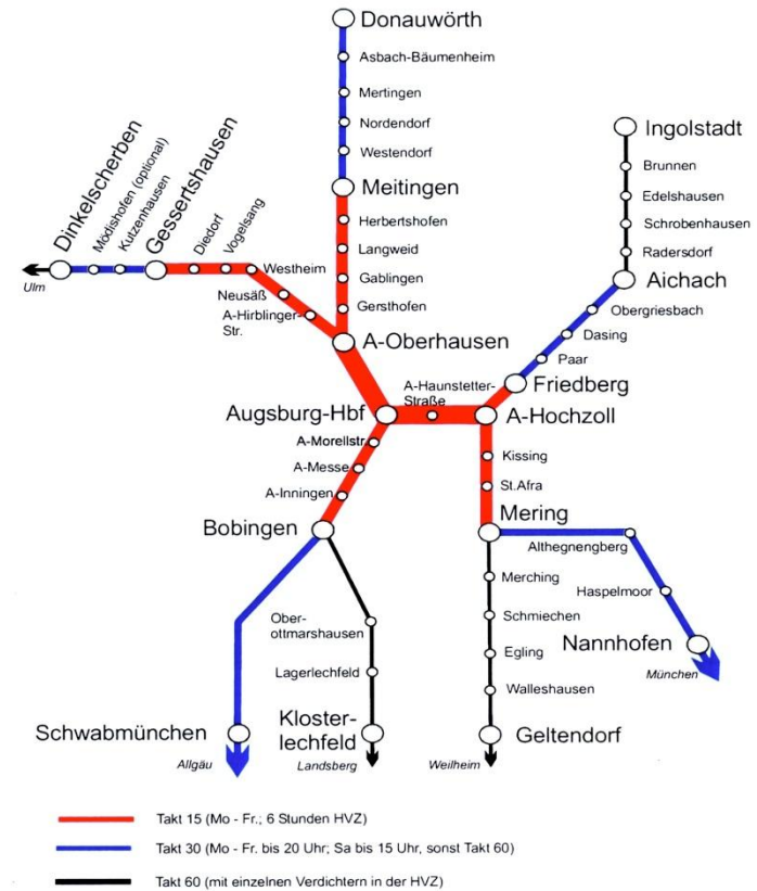
Abbildung 3 Zielzustand des Angebotskonzepts (Zeichnung BEG)